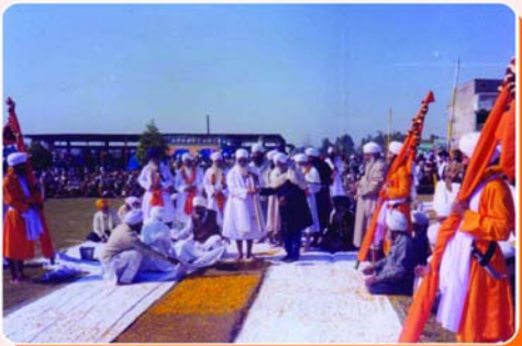
ਗੁਰਦੁਆਰਾ ਈਸ਼ਰ ਪ੍ਰਕਾਸ਼ ਰਤਵਾੜਾ ਸਾਹਿਬ ਦੀ ਨੀਂਹ ਰੱਖਣ ਸਮੇਂ ਮਹਾਂਪੁਰਸ਼।