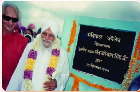
ਜੋਲੀਗਰਾਂਟ (ਦੇਹਰਾਦੂਨ) ਵਿਖੇ ਮੈਡੀਕਲ ਕਾਲਜ ਦਾ ਉਦਘਾਟਨ ਕਰਦੇ ਹੋਏ ਪਿਆਰੇ ਮਹਾਂਪੁਰਸ਼ ਅਤੇ ਨਾਲ ਸ਼ਸ਼ੋਭਿਤ ਡਾ. ਸਵਾਮੀ ਰਾਮ ਜੀ।